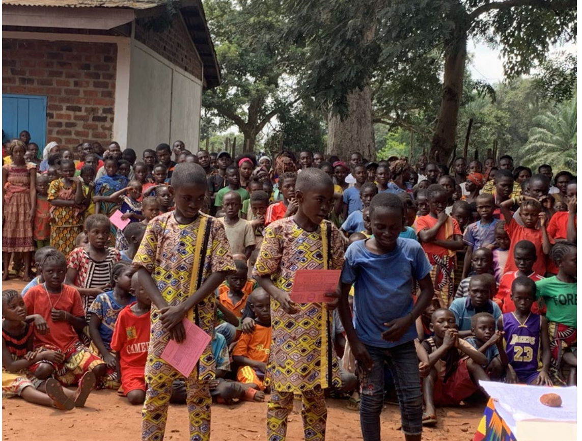
Distribution des prix juillet 2022

Pour les 2 écoles soutenues par les Rameaux Verts qui sont situées en province (Dékoa dans le nord et Bombolet), l'augmentation des salaires des maitres-parents, décidée par l'état, va fragiliser les équilibres financiers. L'aide des Rameaux Verts n'en sera que plus indispensable pour soutenir les familles pauvres et les orphelins.