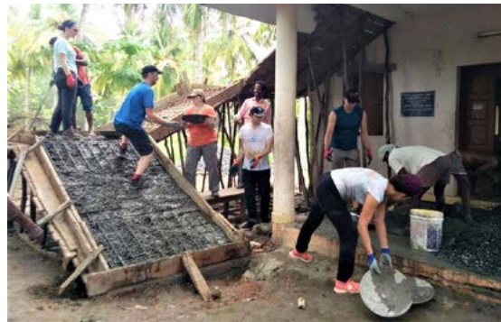
Démarrage des travaux