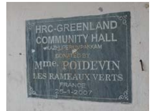
Plaque commémorative rappelant le financement d'origine par un legs d'une donatrice des Rameaux Verts