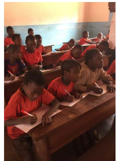
Classe d'enfants à Bombolet

À Bombolet, en bordure de M'baiki (110 kms au sud-ouest de Bangui, dans la région Lobaye), l'école Notre-Dame soutenue par les Rameaux Verts se porte bien. Les bâtiments récents, en partie financés par les Rameaux Verts (2016 à 2018) permettent de scolariser environ 300 enfants. Toutes les classes du primaire sont présentes. Une bibliothèque a démarré et mériterait de recevoir des livres. Le poste de santé voisin, que les Rameaux Verts ont aussi aidé, fonctionne, même si ses moyens restent limités et que beaucoup reste à faire.