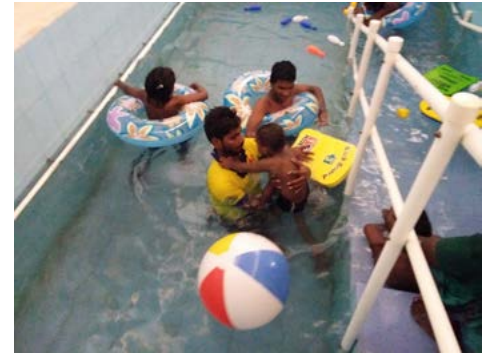
Séance d'hydrothérapie dans la piscine créée au HRC à cet effet

- La fête annuelle des balwadees , les écoles maternelles. La joie de ces enfants dans cette fête colorée sont une belle récompense pour nos donateurs et nous tous.