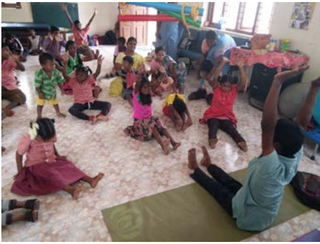
Séance d'exercice pour enfants handicapés