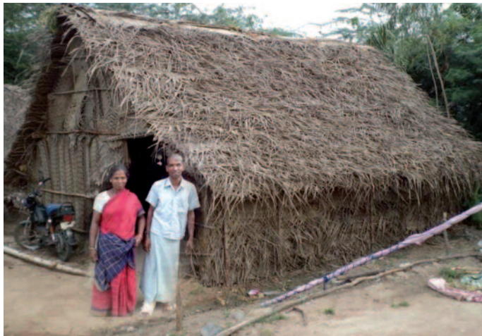
Cahutte pour les cours du soir

Le deuxième volet de notre projet est de poursuivre cette action de scolarisation en proposant à plusieurs grands enfants de cette communauté de poursuivre leur scolarité dans un pensionnat de qualité à Pondichéry, si les parents l'acceptent. Nous voulons trouver, parmi vous donateurs, de nouveaux parrains pour le financer. Sachez qu'avec 220€ par an (soit 73€ après déduction fiscale) vous financez la totalité des frais (scolarité, pensionnat, habits, matériel scolaire) pour l'année scolaire de l'un de ces enfants.