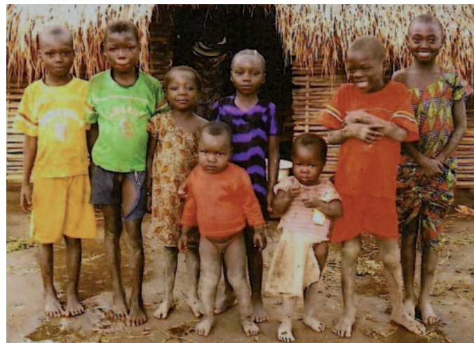
Des enfants va-nu-pieds réfugiés en brousse

Aux M'Brès, les 19 écoles ont pu rouvrir leurs portes et les élèves s'y sont engouffrés à la suite de leurs instituteurs et des 41 maîtres-parents. Le collège-lycée a retrouvé son proviseur et ses professeurs.